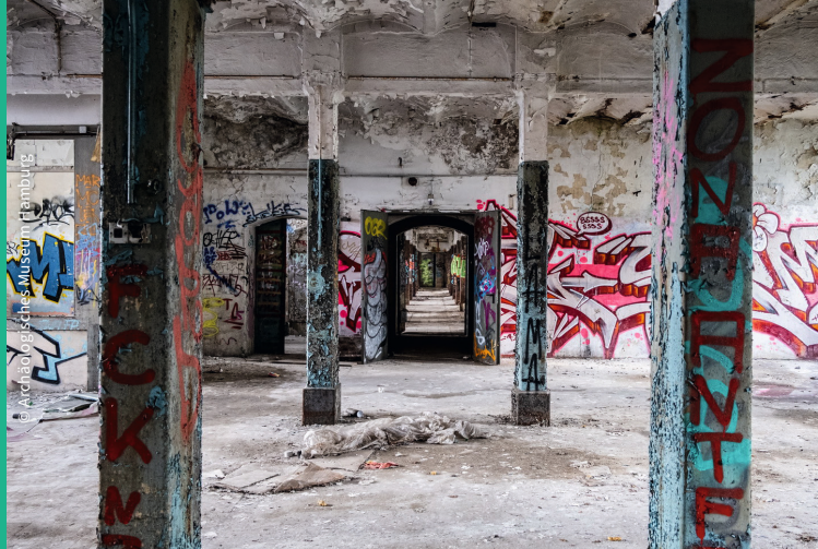
New-York Hamburger Gummi-Waaren Compagnie