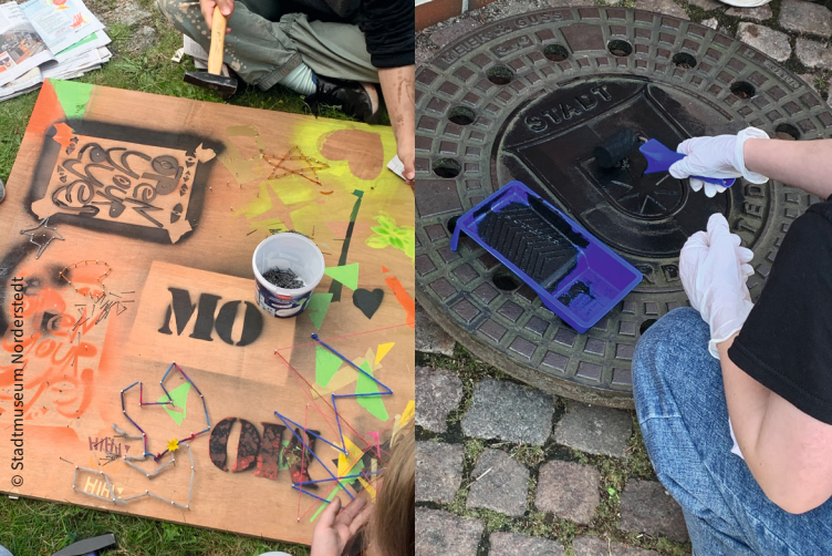
Arbeitsergebnisse aus den Workshops